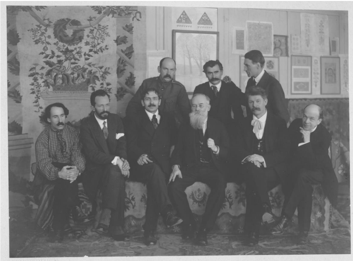
Засновники Української академії мистецтв. Стоять (зліва направо): Георгій Нарбут, Василь Кричевський, Михайло Бойчук. Сидять: Абрам Маневич, Олександр Мурашко, Федір Кричевський, Михайло Грушевський, Іван Стешенко, Микола Бурачек. 1917 р.