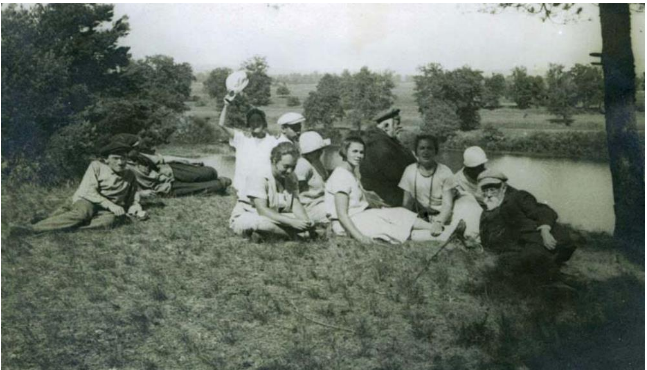
Експедиція академіка Володимира Вернадського (перший справа) до озера Заспа. Конча-Заспа, 26 серпня 1928 р.