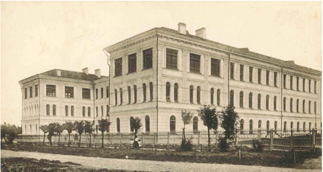
Центральний корпус Кам'янець-Подільського державного українського університету, урочисто відкритого 22 жовтня 1918 р.