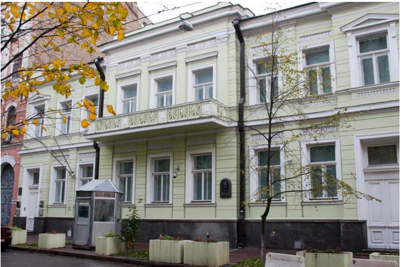
Колишній особняк Василя Симиренка. Тут у 1915–1921 роках розміщувалося Українське наукове товариство. Нині – Посольство Великої Британії в Україні. Київ, вул. Десятинна, 9 (у ті роки – вул. Трьохсвятительська, 23). Фото сучасне.