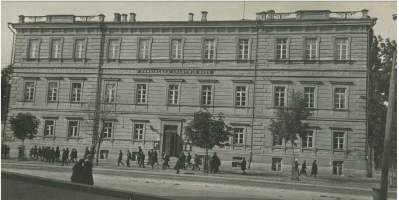
Будівля Української Академії наук. Київ, вул. Велика Володимирська, 54, [1919– 1921 рр.].