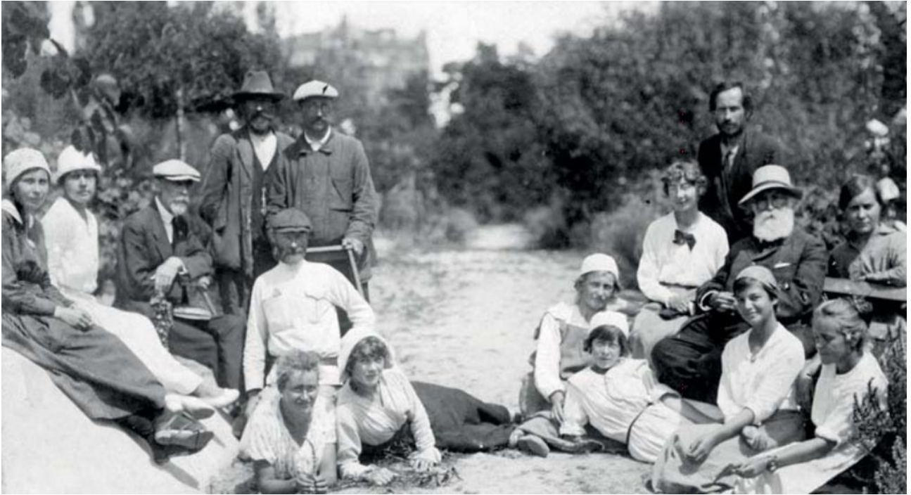
Директор Акліматизаційного саду УАН акад. М. Ф. Кащенко (другий ряд, 2-й справа) із співробітниками та практикантами саду. Київ, 29 липня 1919 р.