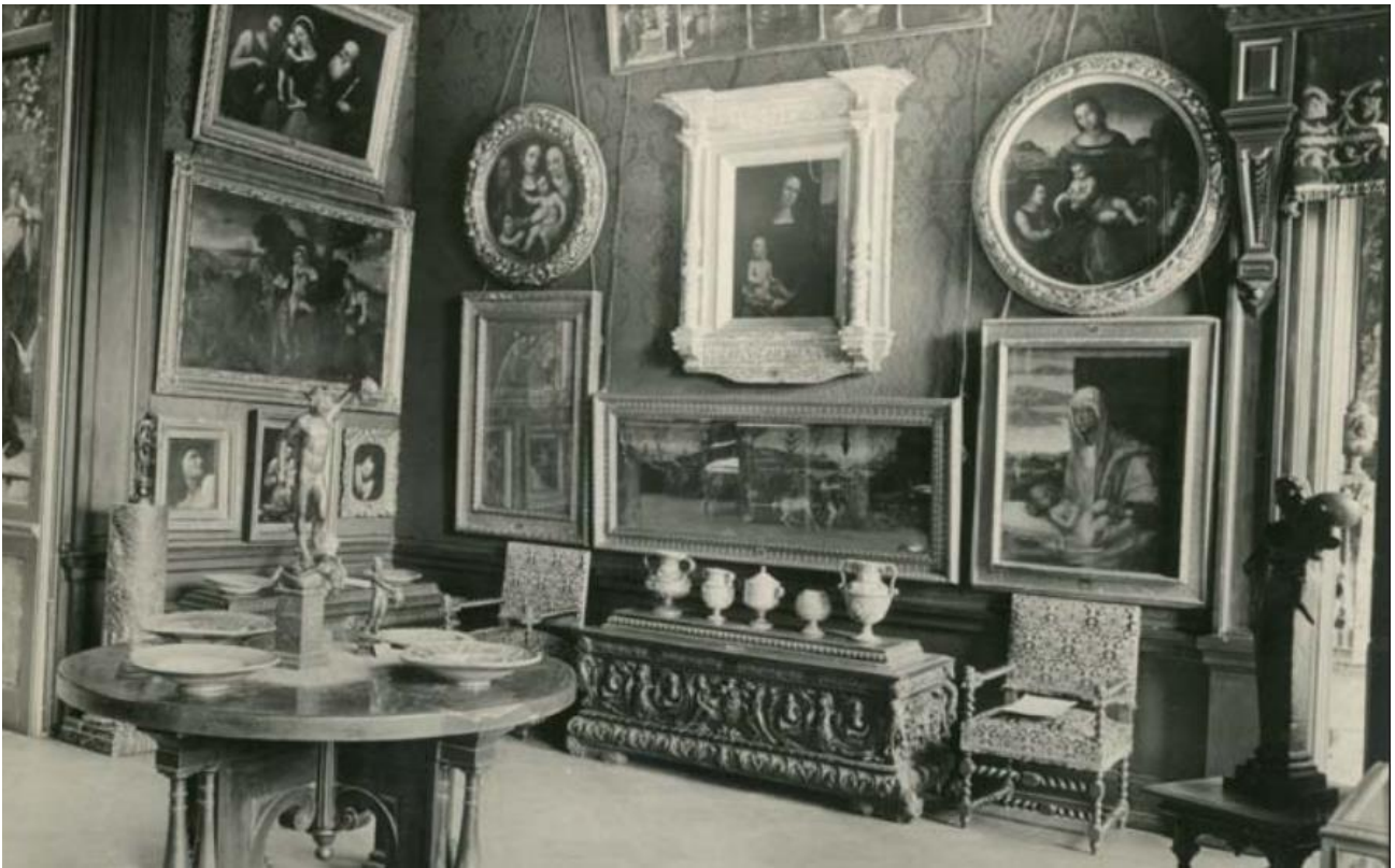
Експозиції Музею мистецтв ВУАН (нині – Національний музей мистецтв імені Богдана та Варвари Ханенків). Київ, [1920-ті рр.].