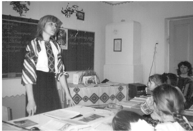
Світила української культури в с. Жовчів