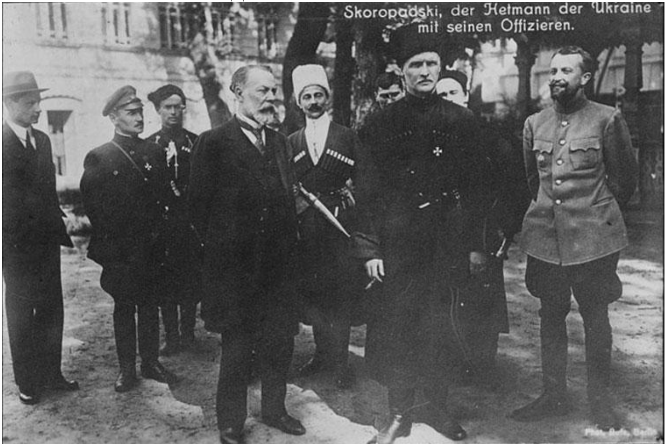
Гетьман Павло Скоропадський з прем'єр-міністром Федором Лизогубом та офіцерами. У центрі ад'ютант Олександр Сахно-Устимович. Київ, 1918 рік