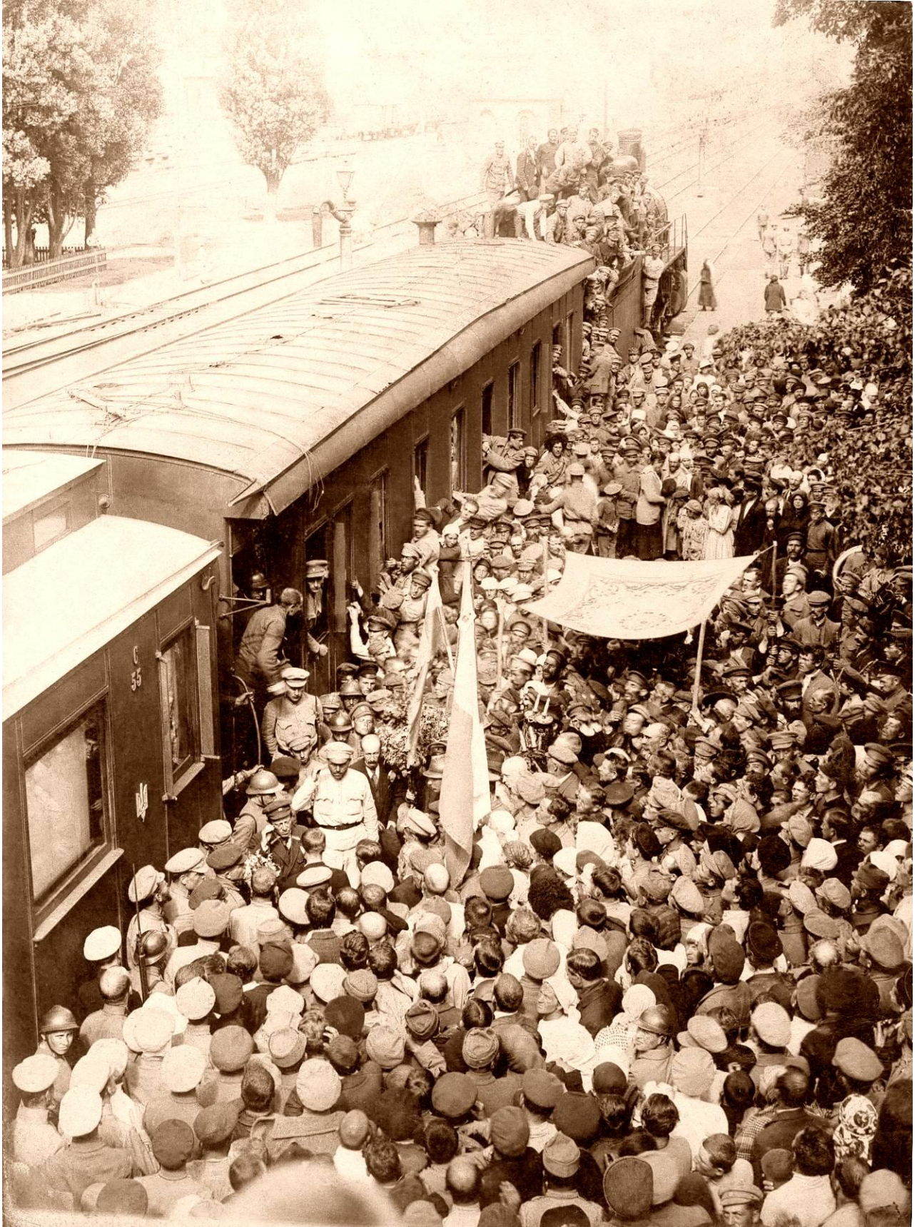
Зустріч Симона Петлюри на залізничному вокзалі у Фастові після звільнення міста від більшовиків. 29 серпня 1919 року