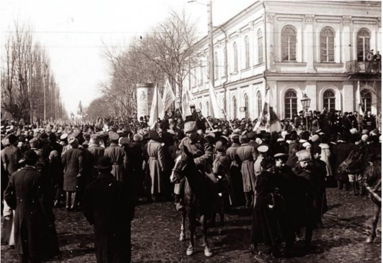
Маніфестація в Києві з нагоди проголошення Української Народної Республіки. 20 листопада 1917 року