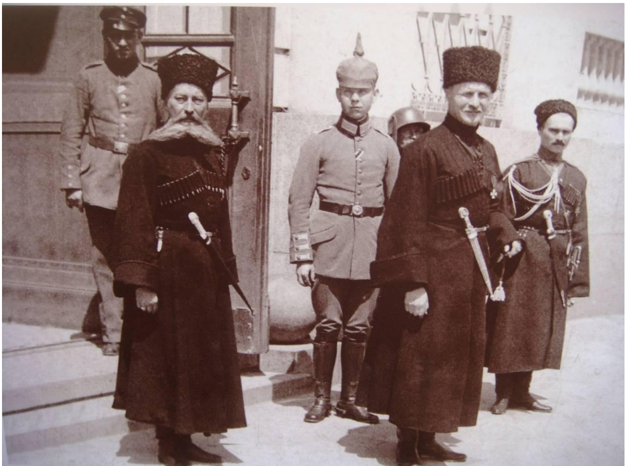
Гетьман Павло Скоропадський з Миколою Сахно-Устимовичем (ліворуч) – командувачем власного конвою. Київ, вул. Катерининська (нині – Липська). 1918 рік