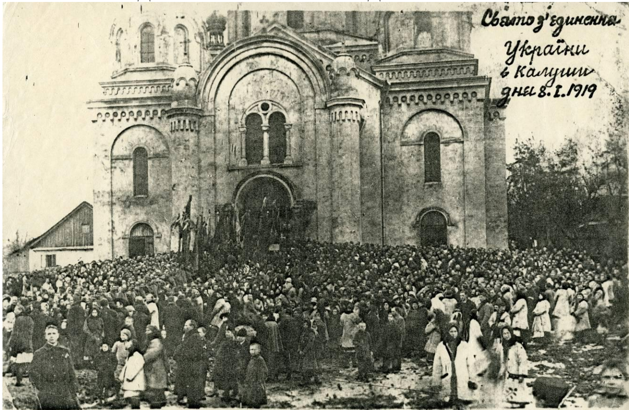
Святкування об'єднання з Великою Україною в місті Калуші. Січень 1919 року