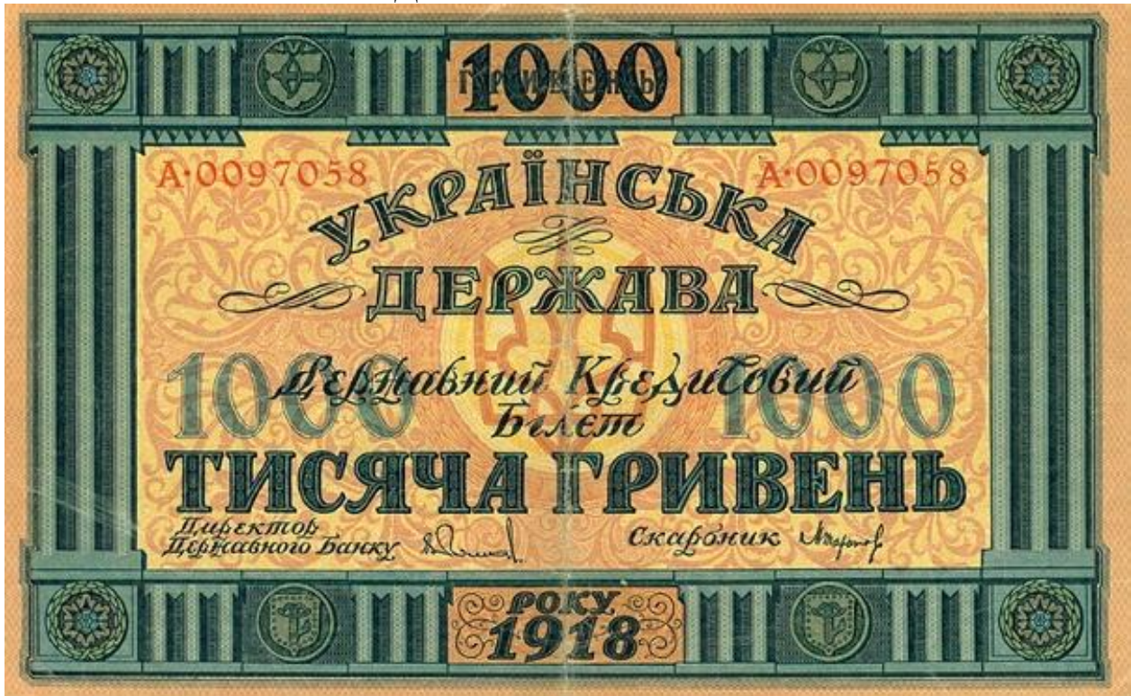
Купюра номіналом у 1000 гривень часів Гетьманату