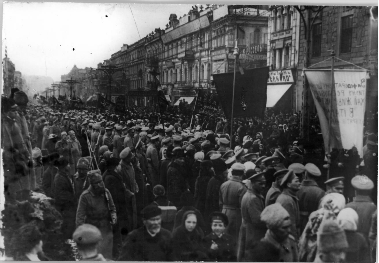
Демонстрація на вулиці Хрещатик у Києві. Березень 1917 року