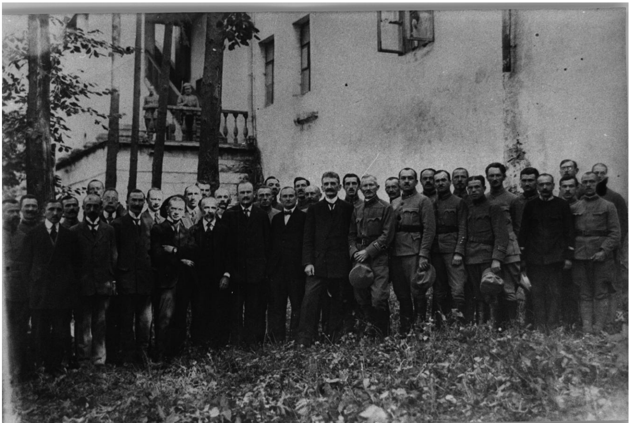
Уряд ЗУНР. У центрі – Президент ЗУНР Євген Петрушевич, державний секретар закордонних справ Степан Витвицький, голова Державного Секретаріату Сидір Голубович. Кам'янець-Подільський. Осінь 1919 року