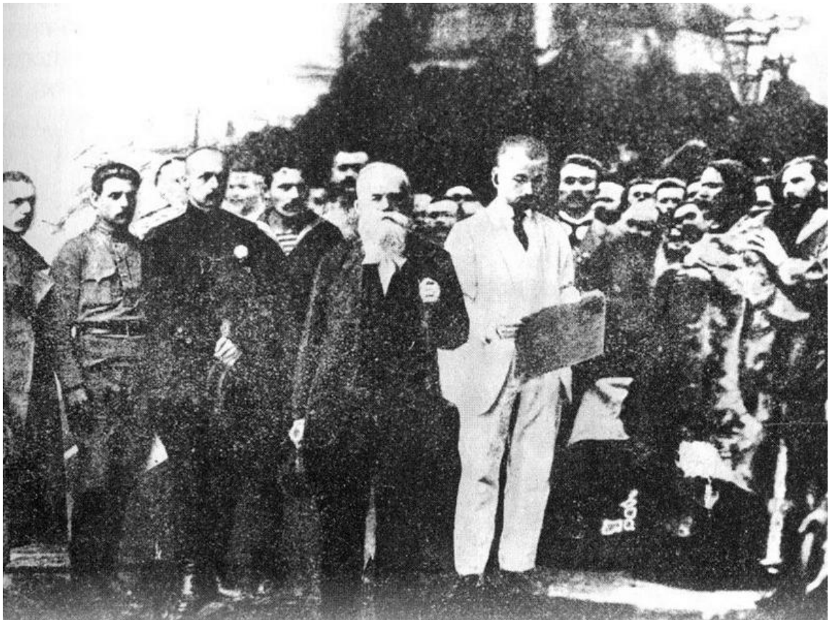
Проголошення I Універсалу Української Центральної Ради на Софійській площі. У центрі – Михайло Грушевський. Червень 1917 року