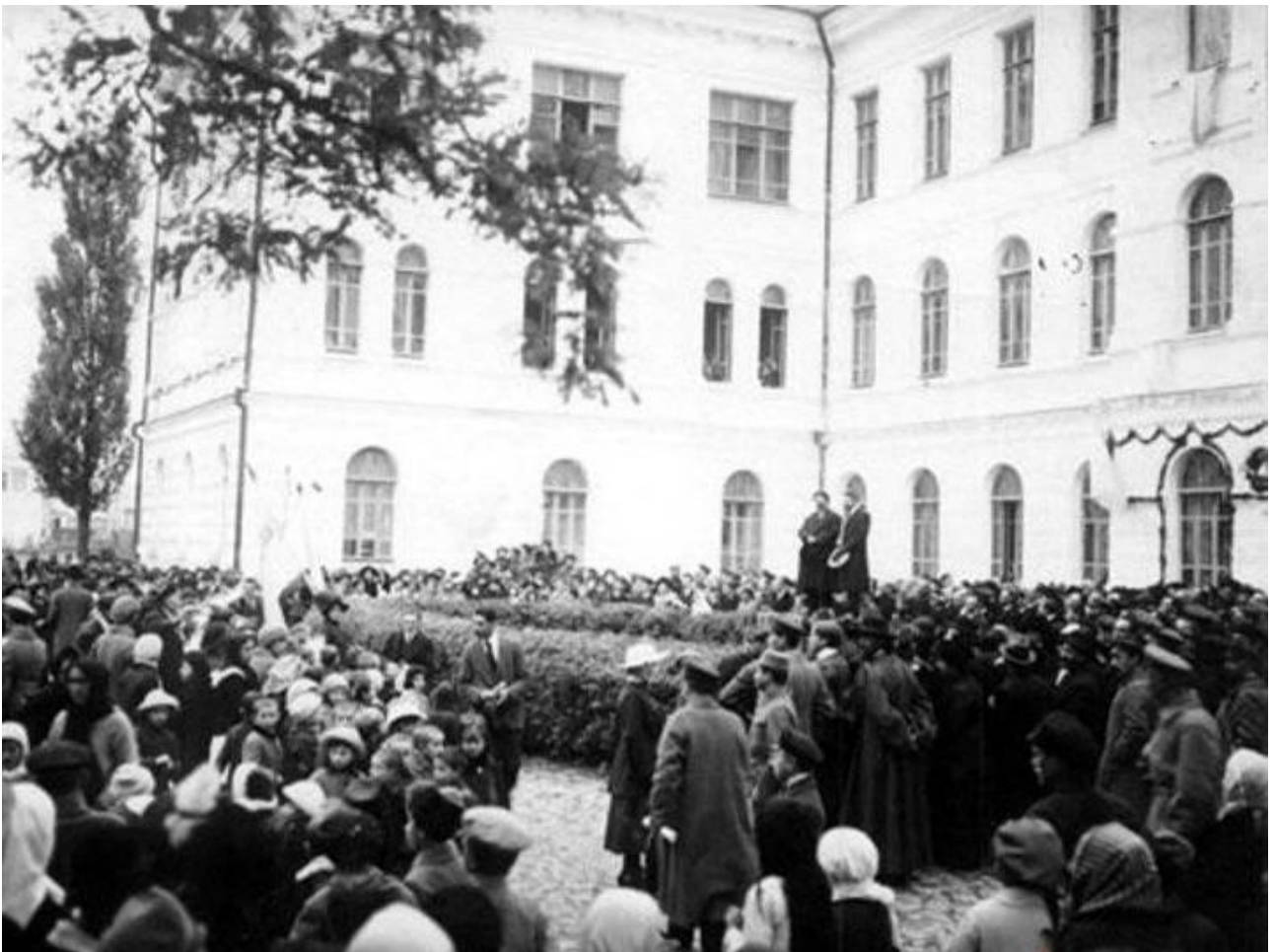
Урочисте відкриття Кам'янець-Подільського університету за участю Івана Огієнка – першого ректора. 1918 рік