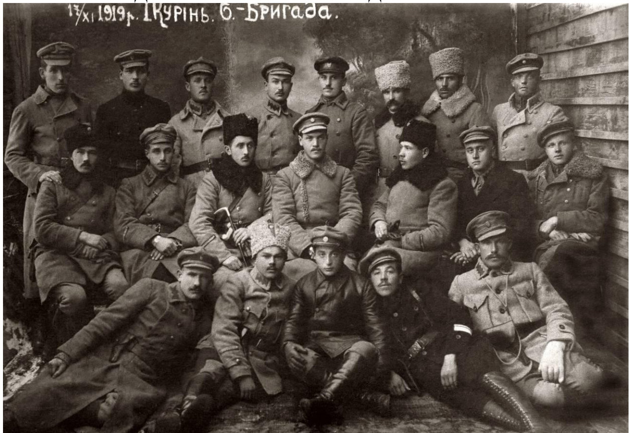
Перший курінь шостої бригади Української Галицької Армії. 17 листопада 1919 року